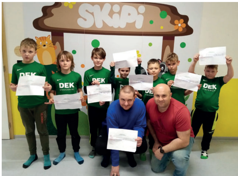
Trenéři starší přípravky.

V sobotu dopoledne jsme vyjeli vlakem z Týniště nad Orlicí do SKIPI-PARKU v Letohradě, ve kterém kluci strávili tři hodiny na trampolínách, tříkolkách, na lanové dráze a prolézacím hradě. Bylo očividné, že volba byla správná. Nálada byla skvělá. Po třech hodinách aktivního pohybu a „blbnutí“ ve SKIPI jsme dobili energii hranolky a kofolou. Parádní sobotní nefotbalový den jsme si moc užili, což dokazují i tyto fotografie.