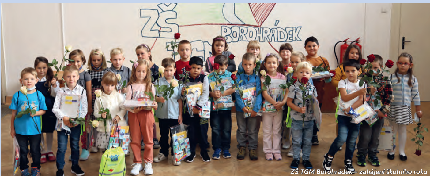
ZŠ TGM Borohrádek – zahájení školního roku