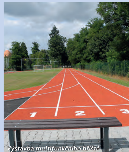
Výstavba multifunkčního hřiště