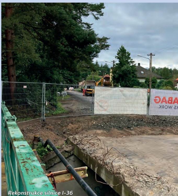
Rekonstrukce silnice I-36