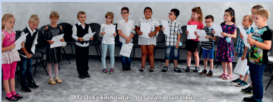
Městská knihovna – pasování prvňáčků