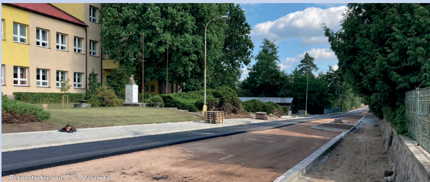
Rekonstrukce v ul. T. G. Masaryka