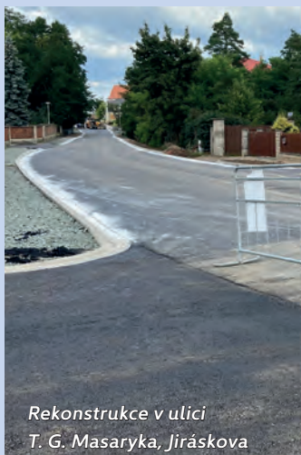
Rekonstrukce v ulici T. G. Masaryka, Jiráskova