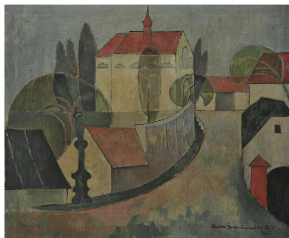
Václav Macháň, „Nedělní ráno“, olej, plátno /54 x 60 cm/ 1963

Krásná rána - a celý rok 2018 plný zdraví, úspěchů, optimismu, pohody, radosti i lásky přeje Vám i Vaším blízkým