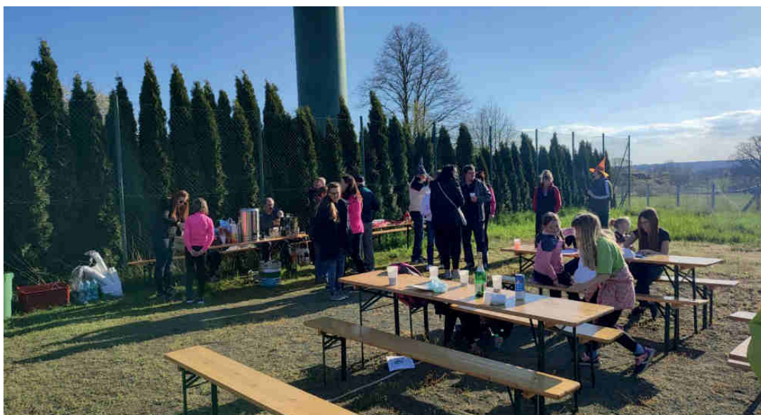
Osadní výbor Šachov

V neděli 30. dubna 2023 jsme uspořádali na Šachově tradiční pálení čarodějnic. U fatry, na kterou navozili Šachováci dřevní hmotu, se povídalo, opékaly vuřty a ochutnávaly napečené dobroty. Pro děti byly připraveny soutěže o drobné ceny. Společně jsme si naši šachovskou akci užili.