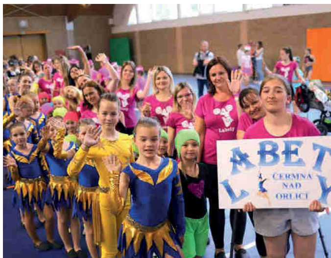
Tým mažoretek Labety